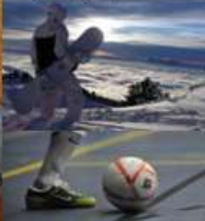
Lore De Bousser ° 5/12/1995 1 e jaar orthopedagogie